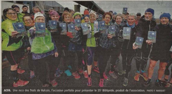
ACFA. Une reco des Trails de Vulcain, l'occasion parfaite pour présenter le 35 e Biblipède, produit de l'association.

Le cadeau parfait, on vous dit. Et autre avantage sur les soldes, il couvre l'année entière, sous réserve de sa disponibilité, au fil de l'écoulement de ses 8.000 exemplaires.