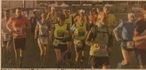
Huit heures hier, à Pia. Les coureurs du 50 km et du 100 km démarrent.