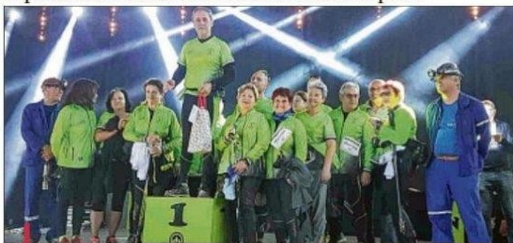
Les coureurs pennois ont remporté le challenge du nombre à La Gardannaise.