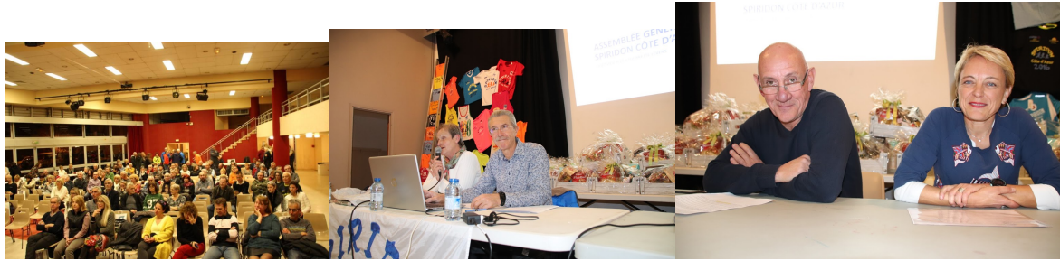
*Belle assemblée générale pour le Spitions Côte d'Azur !