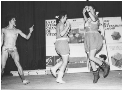
LES 12 BORNES DE METZ

Bon ! Pour avoir été, en tout bien tout honneur, son fidèle compagnon de route pendant toutes ces années, la rigueur qui me caractérise m'oblige à vous révéler le côté obscur du personnage... Ces révélations n'entachent que peu, si peu, le portrait de la sainte femme, mais permettent de comprendre que dans tout un-e chacun-e, une part d'ombre sommeille, qui ne demande qu'à voir le jour.